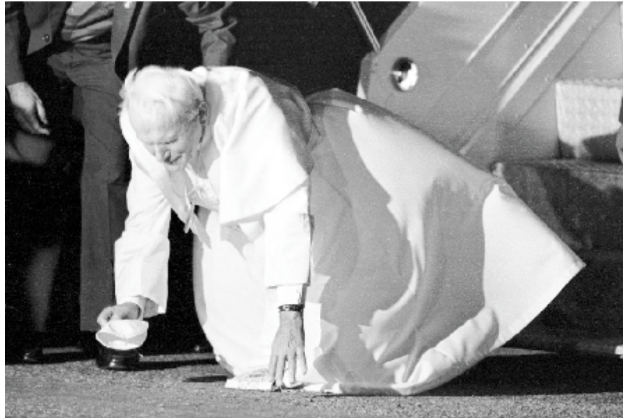
O beijo no solo foi símbolo da ação missionária de João Paulo II

Missionários são todos aqueles que recebem o batismo e, assim, são introduzidos na vida cristã. Por meio deste sacramento somos inseridos na vida da Igreja e levados a proclamar a Boa Notícia a todos os cantos. O Beato João Paulo II soube ser missionário e assumir seu batismo com amor e responsabilidade. Tornou-se um fiel servidor de Cristo e, sendo eleito papa, não ficou preso aos limites territoriais do Vaticano. Estendeu a sede da Igreja para além de suas fronteiras, saiu de seu presbitério e ergueu em cada país que visitou um novo altar. O beijo que foi capaz de dar em cada chão dos lugares que visitou equivalia ao ósculo dado ao altar antes da Santa Missa. Nesta, o celebrante faz uma inclinação e depois beija a mesa da partilha. Tal gesto tem um endereço: não é propriamente para o mármore ou madeira do altar, mas para o Cristo, que é o centro de nossa fé.